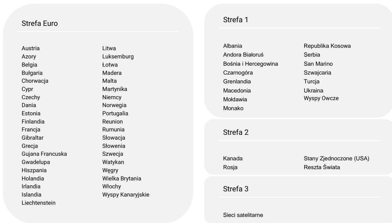
Tabela 11. Opłaty za międzynarodowe połączenia głosowe i połączenia wideo oraz międzynarodowe wiadomości SMS i MMS