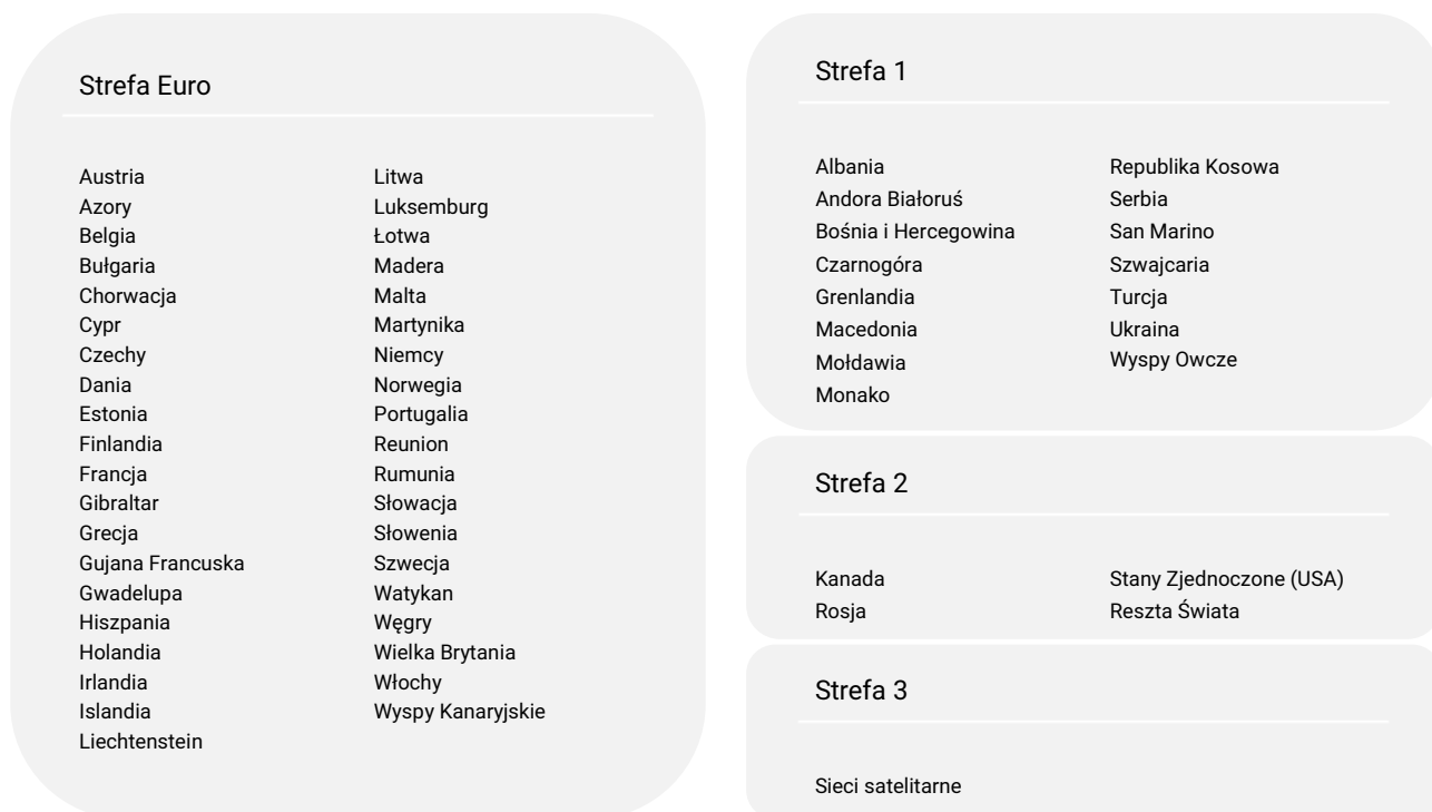
Tabela 11. Opłaty za międzynarodowe połączenia głosowe i połączenia wideo oraz międzynarodowe wiadomości SMS i MMS